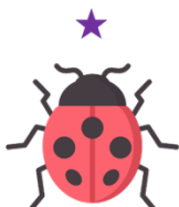
ladybird ['leɪ.di.bɜ:d] ladybug ['leɪ.di.bʌg]