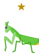
mantis ['mæn.tɪs] praying mantis [.preɪ.ɪŋ 'mæn.tɪs]

insect ['m.sekt] 昆蟲 / bug [bʌg] 小蟲子 (紅色框框的部分)